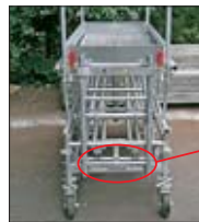
機番プレート取付位置