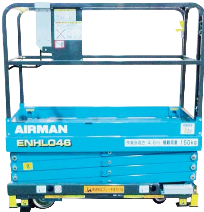
上昇時にアウトリガーが自動接地