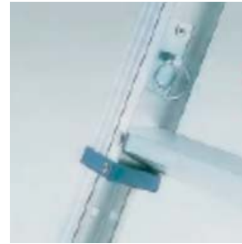
脚の伸縮により、あおり、荷台の高さにぴったりとフィットします