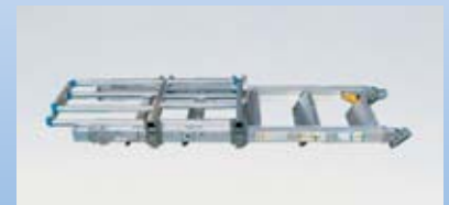
手掛かり枠が折りたたむので、少ないスペースで収納できます