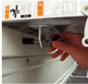
トラックとの固定が簡単