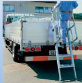
手摺があるので安心して昇降できます