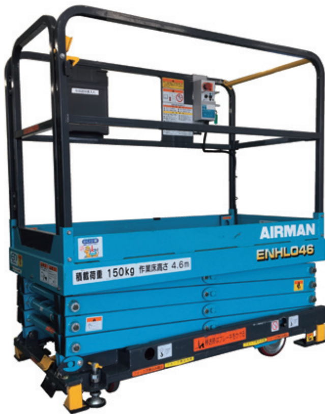
上昇時にアウトリガーが自動接地