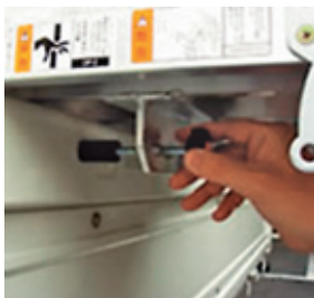
トラックとの固定が簡単