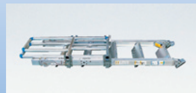
手掛かり枠が折りたたむので、少ないスペースで収納できます