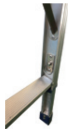
脚の伸縮により、あおり、荷台の高さにぴったりとフィットします