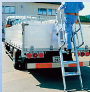
手摺があるので安心して昇降できます