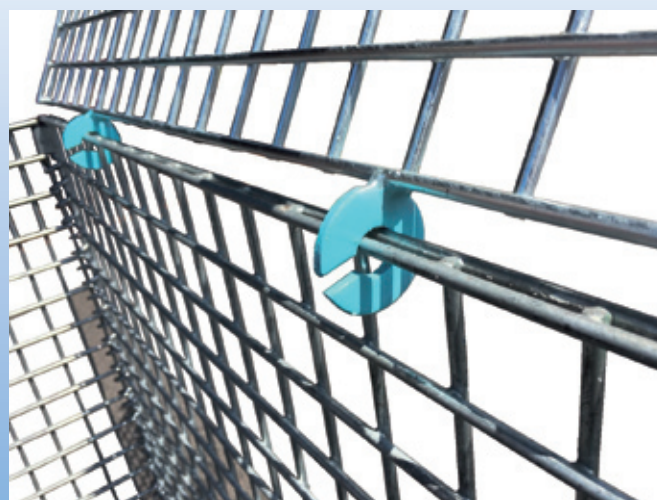
脱着簡単！専門工具は不要です。