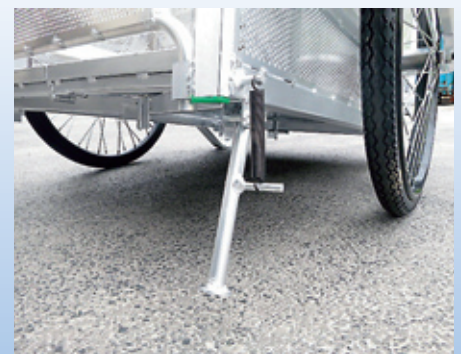
収納式スタンド付き