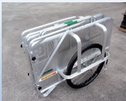
コンパクトに折りたたみ可能