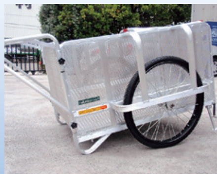
側板はパンチングメタル