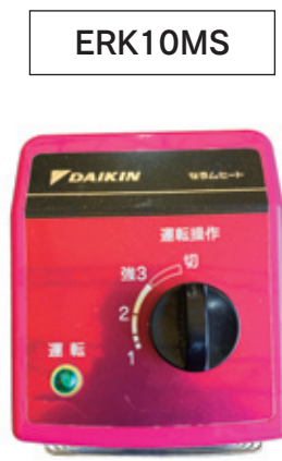
設定温度 = 3段階調整