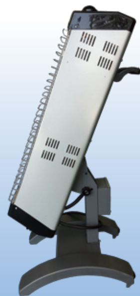
照射角度の調整が可能