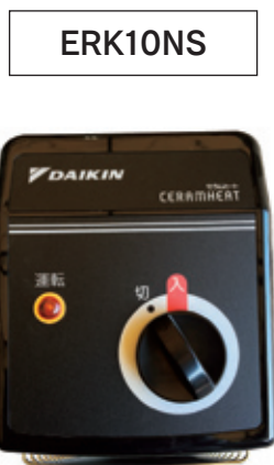
設定温度 = 調整なし