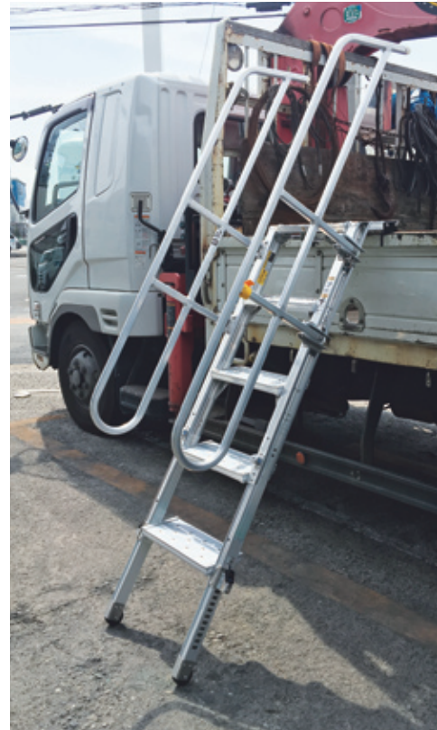
1t～10tトラックまで使用可能！ (車種・形状・使用条件によって設置できない場合もあります)