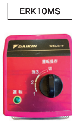
設定温度 = 3段階調整