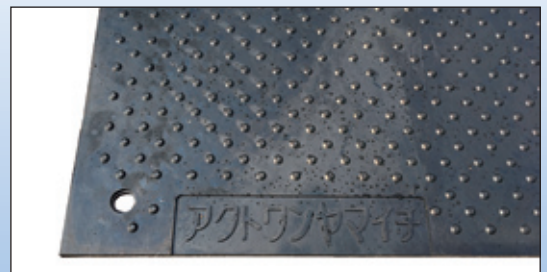
当社社名入りなので、他社品と間違えません