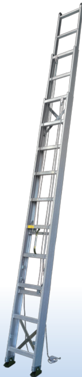
三連ハシゴ サヤ管式