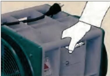
取っ手も付いて持ち運びもラクラク。