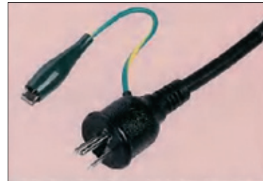
2P/3P 兼用のロックプラグ付きなので使い分けが可能。