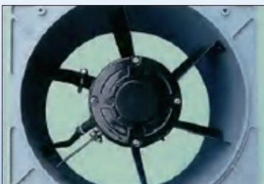
ゆとり設計のパワフル550Wモータ。