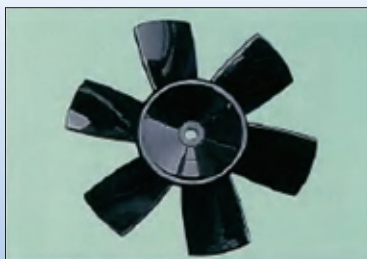
高効率・低騒音羽根車を搭載。