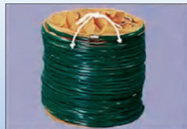
自由に伸び縮みして曲がりにも対応するスパイラルダクト。取り付け簡単。